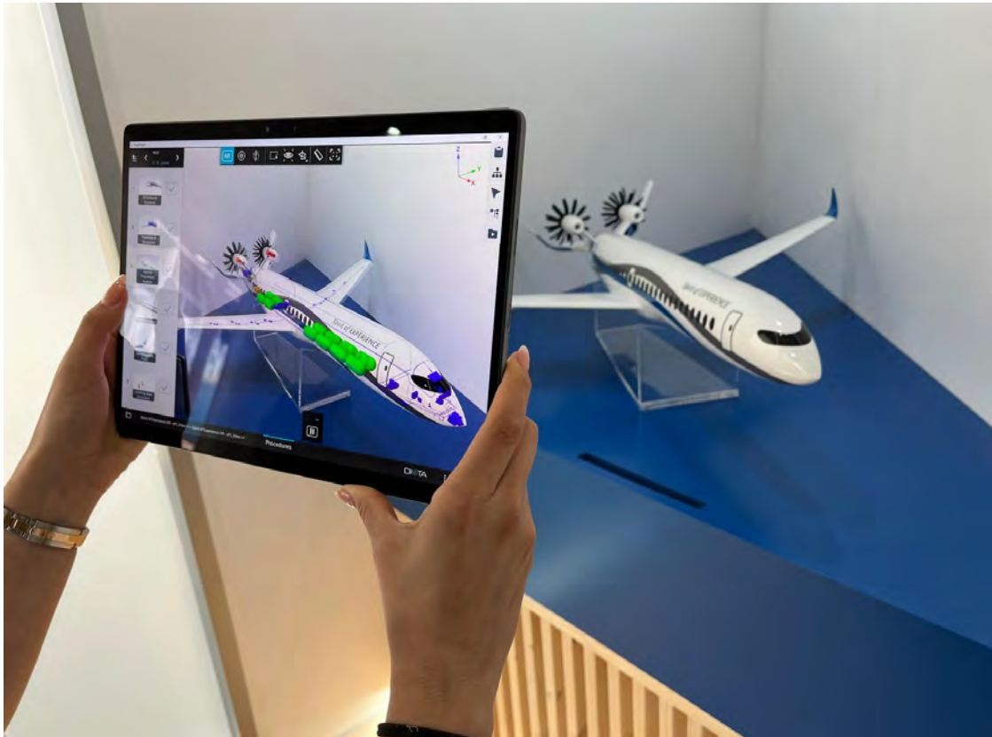
צילום רנטגן למטוס באמצעות תוכנה של דאסו סיסטמס