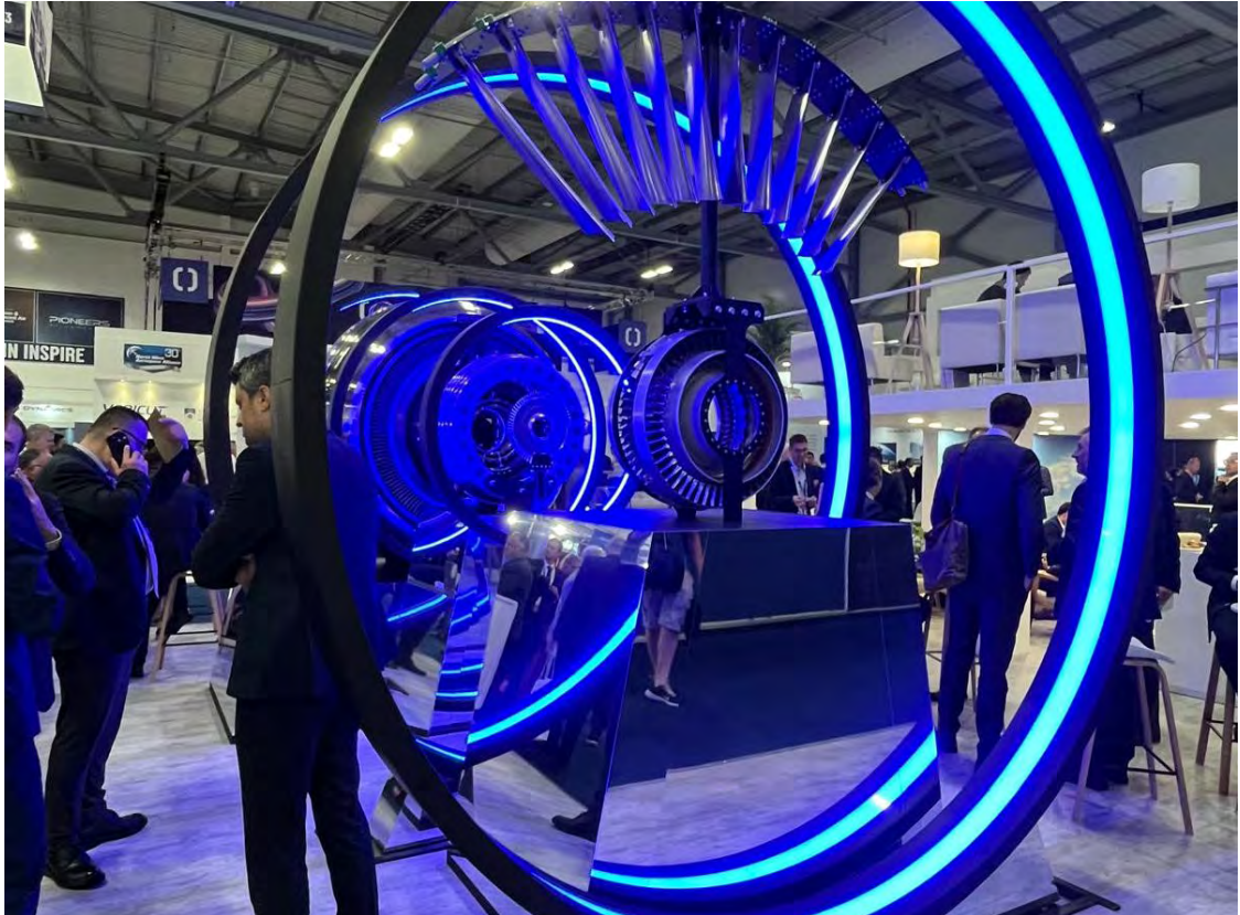
כך מציגים מנוע