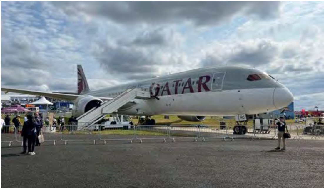
בואינג 787 דרימליינר בצבעי חברת התעופה הקטארית