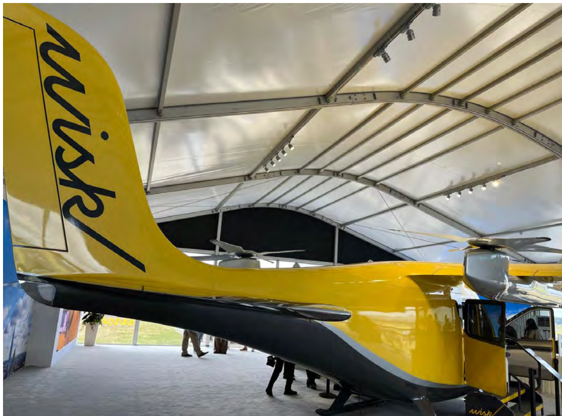
המונית המעופפת של Wisk