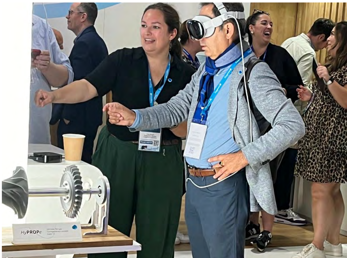
VR הדגמה באמצעות משקפי