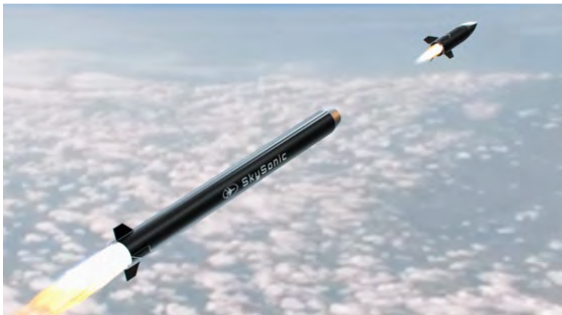
טיל נגד טילים היפרסוניים, סקיי סוניק מתוצרת רפאל.