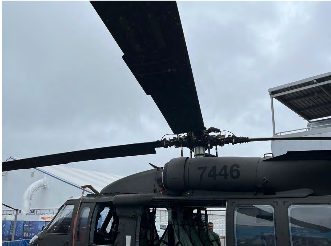
בלאק הוק של סיקורסקי