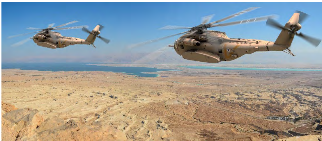
הדמיה של היסעור K בצבעים ישראליים