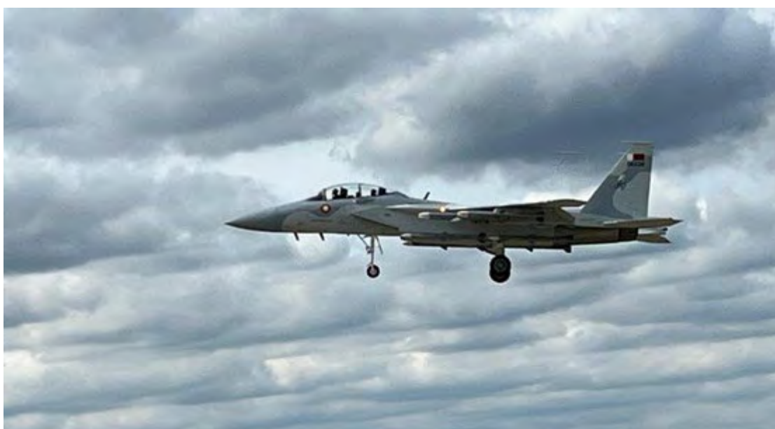
F-15QA בצבעים קטאריים, נוחת בסיום התרגיל שביצע בפארנבורו

ב-13 באפריל השנה כ-75 כטב"מים איראניים מדגם שאהד.