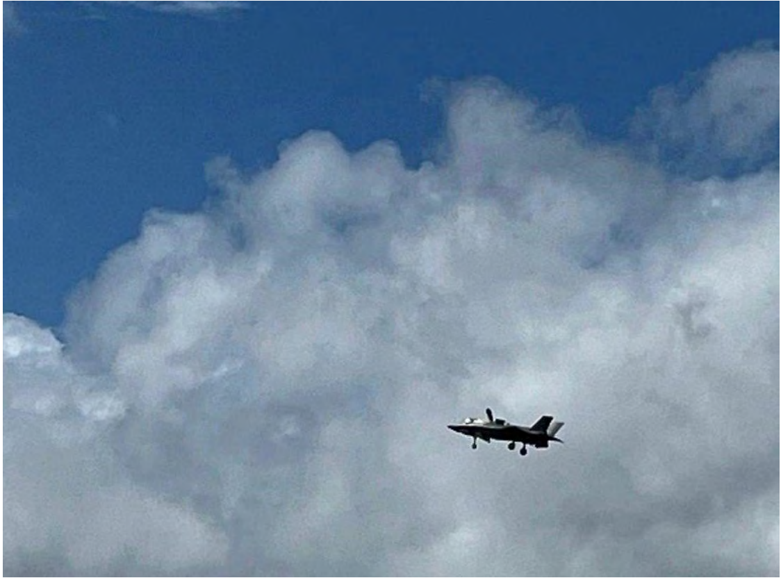
החמקן, F-35 מדגם B, הממריא אנכית, של חיל האוויר המלכותי