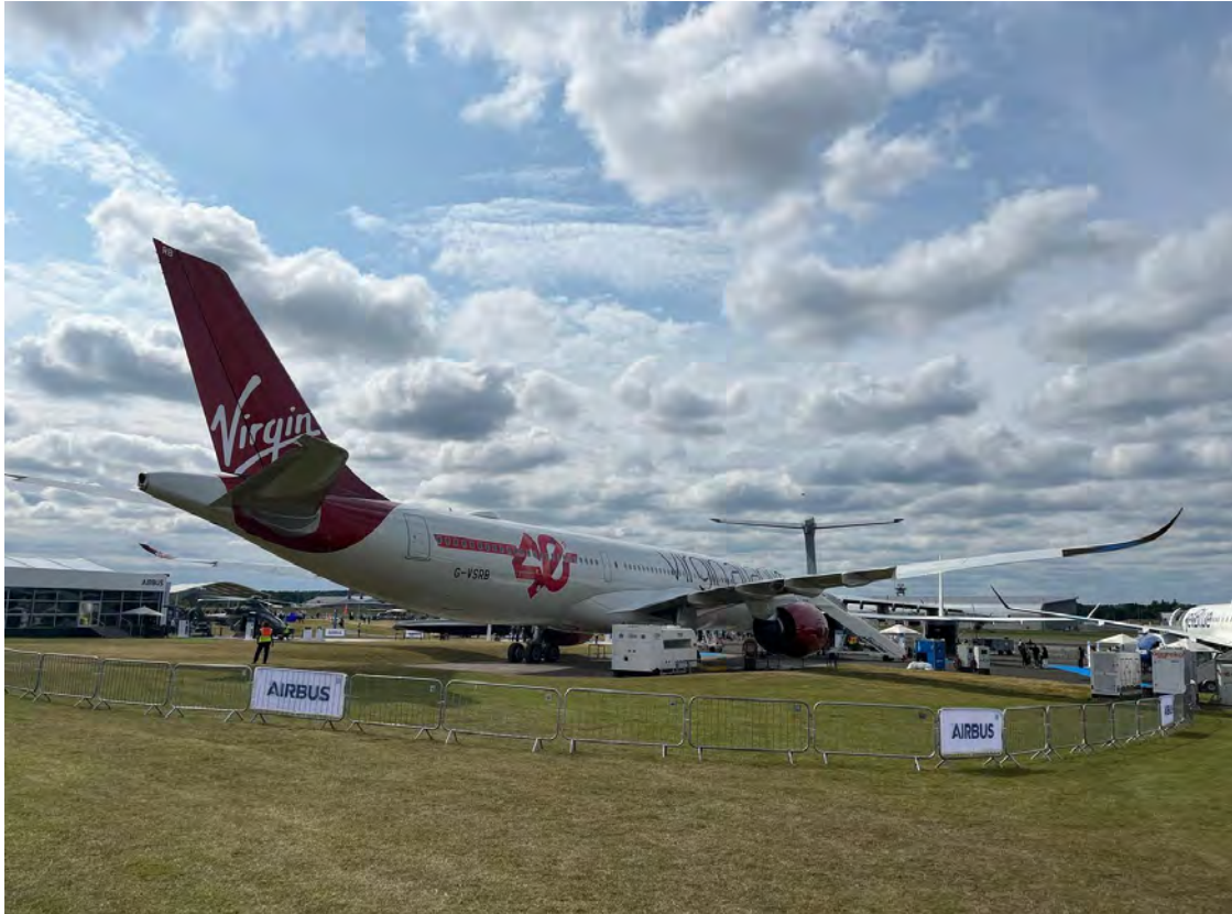
A-330-900 הגרסה החדשה של המטוס רחב הגוף