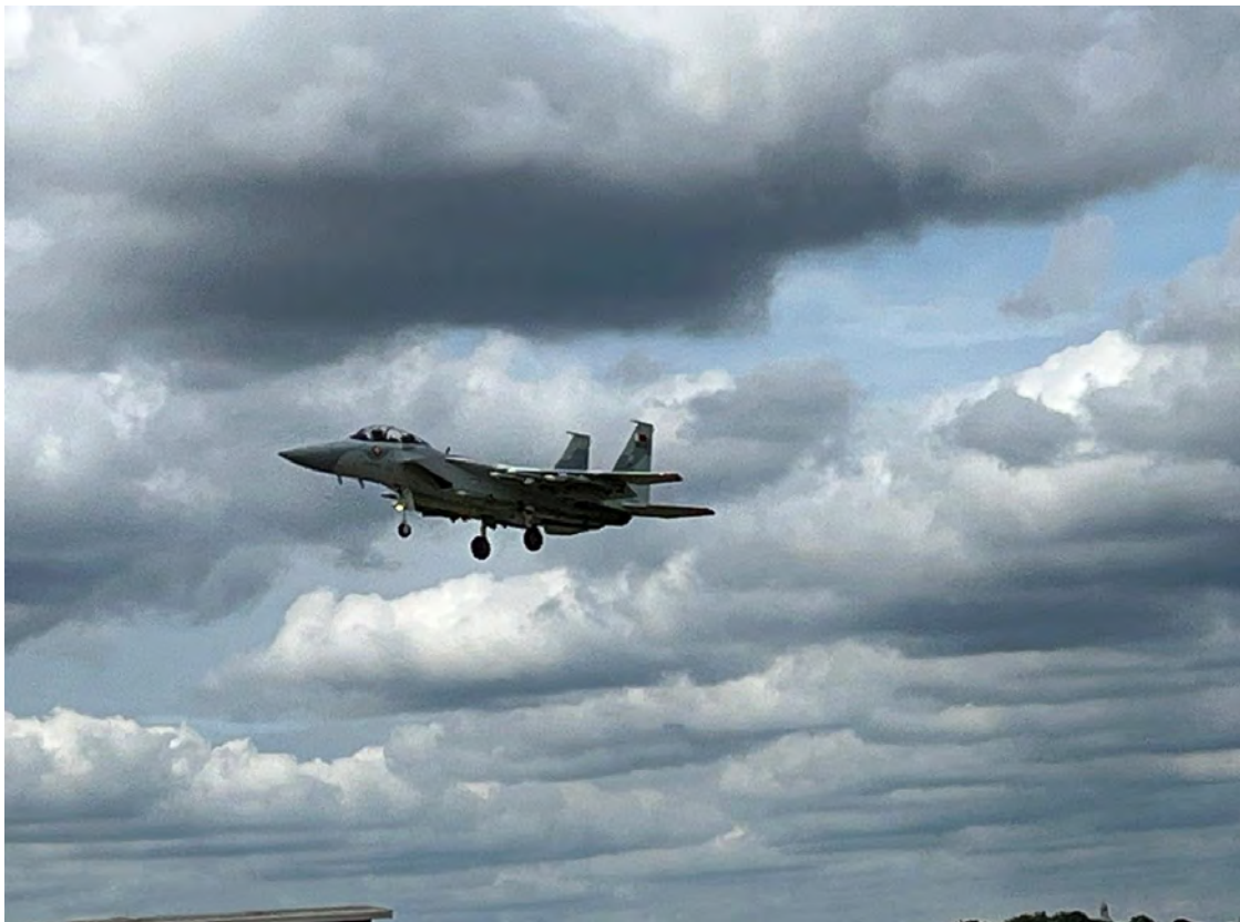
מהדגם החדש, המיועד לחיל האוויר F-15