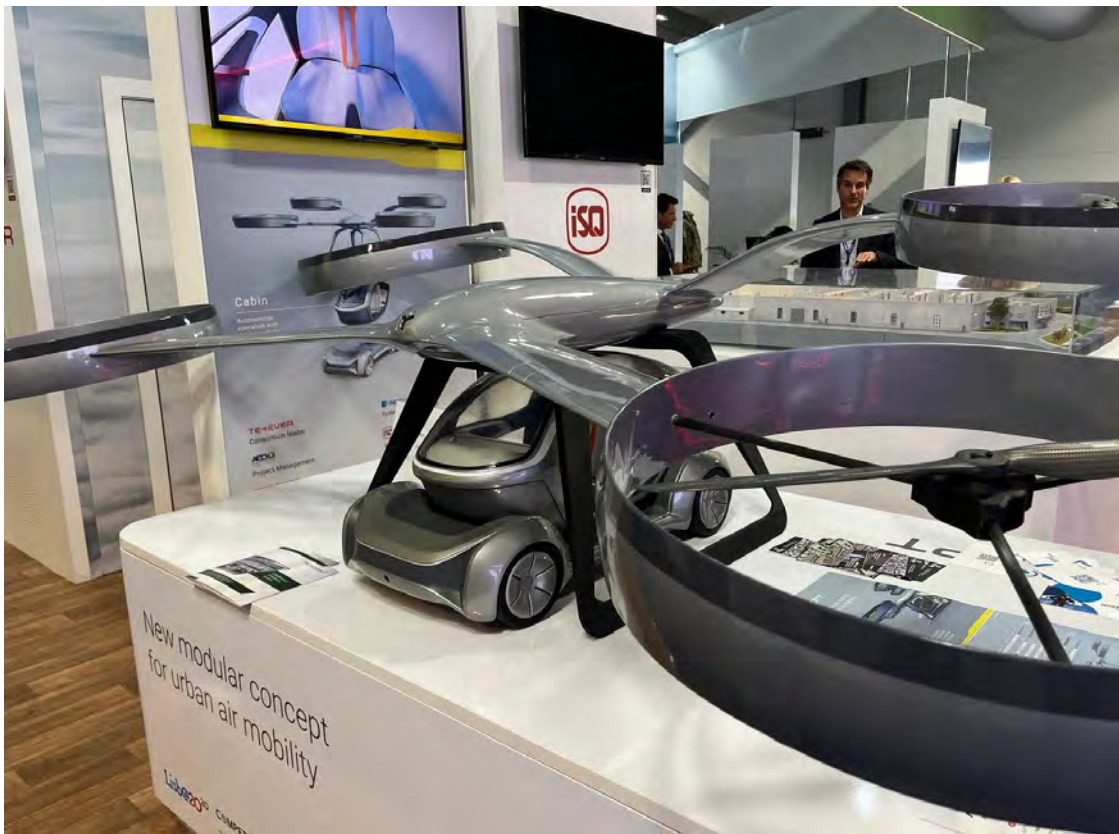
רחפן מאויש - קונספט