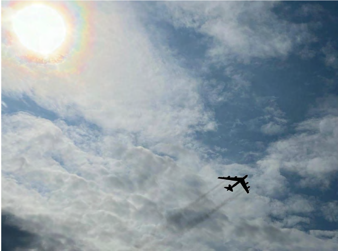
B52 - המפציץ הגרעיני, בשמי הסלון