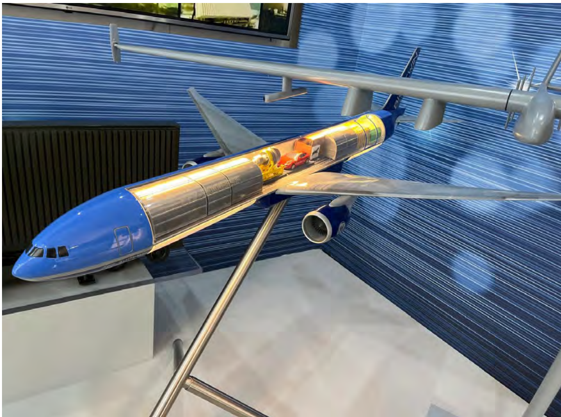
777 מוסב נחבא אל הכלים