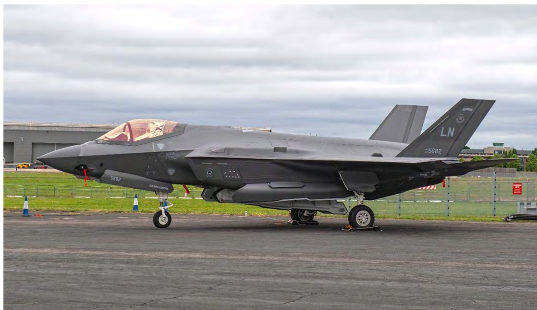
F-35 על מסלול ההמראה בפארנבורו.