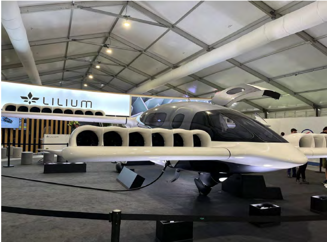
ליליום, אחד הפרויקטים המעניינים של מכונות חשמליות מעופפות