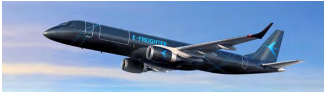
גרסת התובלה של ה E-195

בקולקציה האזרחית הציגה אמבראר את ה E-195-E2 שאותו הגדירה כמטוס צר הגוף היעיל והשקט ביותר בעולם; מה הפלא שעל גוף המטוס נצבעה בענק הסיסמה: Profit Hunter? כן הוצגה לראשונה גם גרסת התובלה של המטוס ה-E-195F