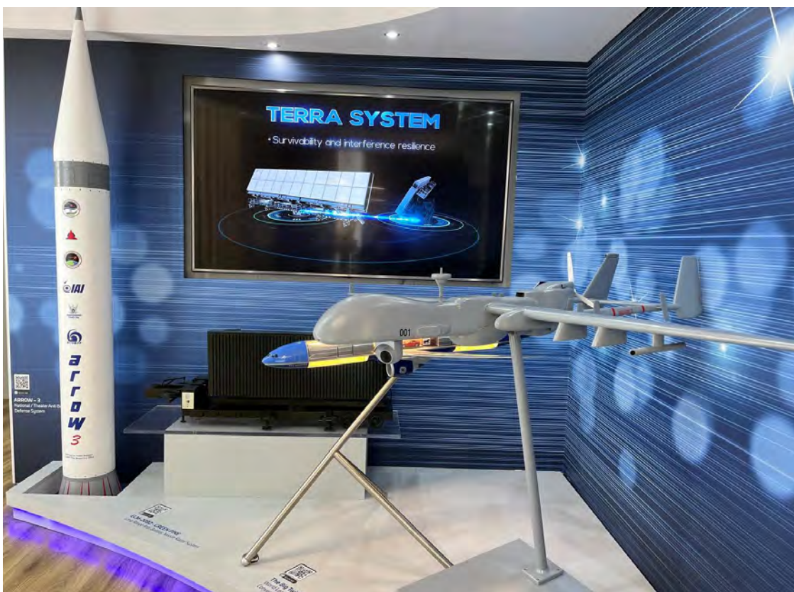
בכניסה לביתן התעשייה האווירית, דגמים של החץ, איתן ו-777 מוסב