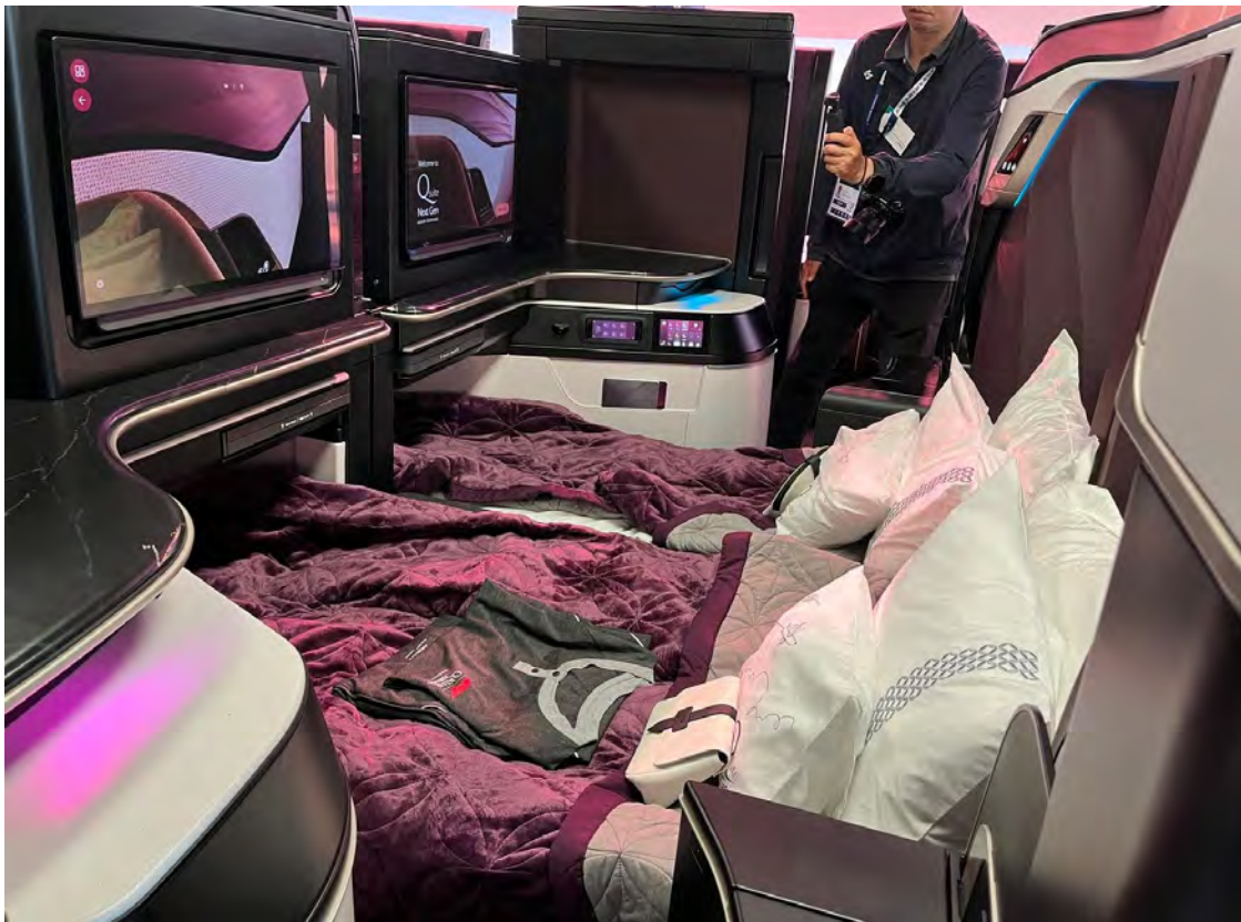
סוויטה Q של קטאר איירווייז. טיסה בקריטריונים אחרים