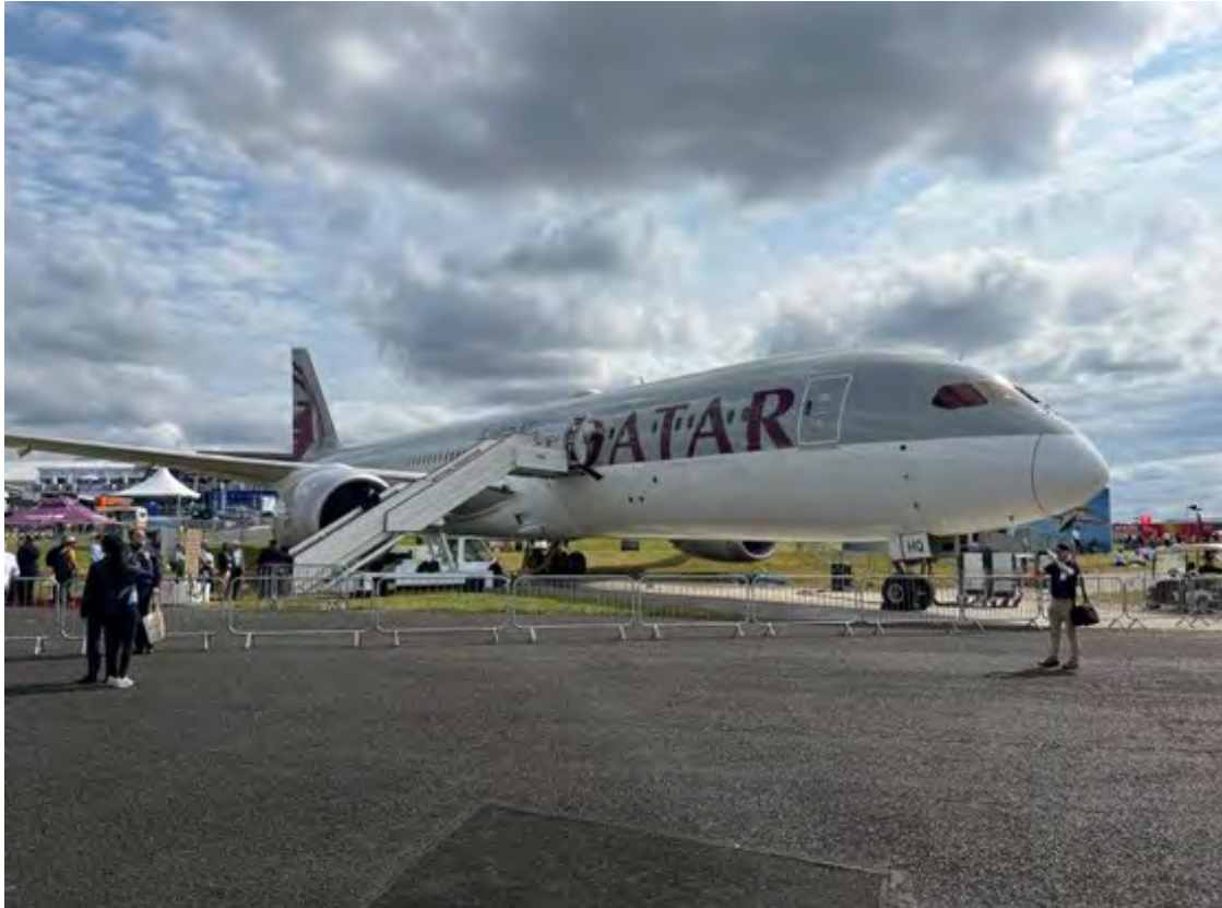
בואינג 777 דרימליינר של קטר אירוויז