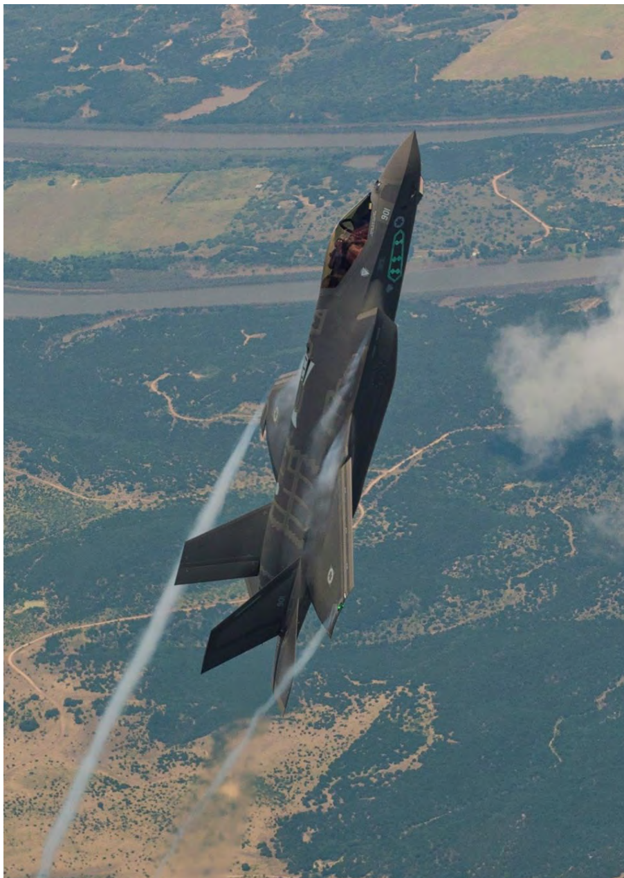
אדיר ישראלי בנסיקה.

בין השדרוגים המרכזיים – כל מערכת החיישנים, יכולת נשיאה של סוגים רבים יותר של חימוש, יכולת משופרת לביצוע משימות משותפות. interoperability בפארנבורו הכתירו את ה-F-35 כ"מטוס הקרב הטקטי הטוב ביותר הטס היום בעולם." 18 מדינות מפעילות אותו ברחבי העולם ויש התעניינות גוברת. לישראל הגיעו כבר 39 מטוסים מתוך ה-50 שבהזמנה המקורית ו-25 מטוסים נוספים ישלימו את המספר ל-75.