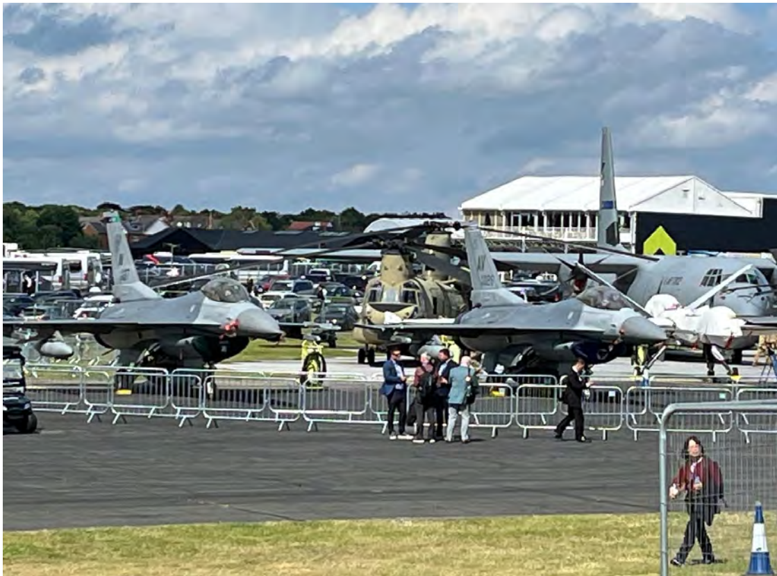
זוג מטוסי F-16, מסוק צ'ינוק, הרקולס J חלק מהקולקציה הצבאית בתצוגה הקרקעית