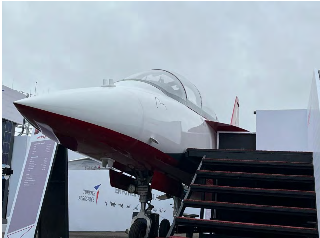
הוריט, מטוס אימונים קל מתוצרת טורקיה